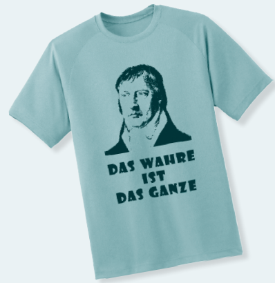
Georg Wilhelm Friedrich Hegel (1770-1831)