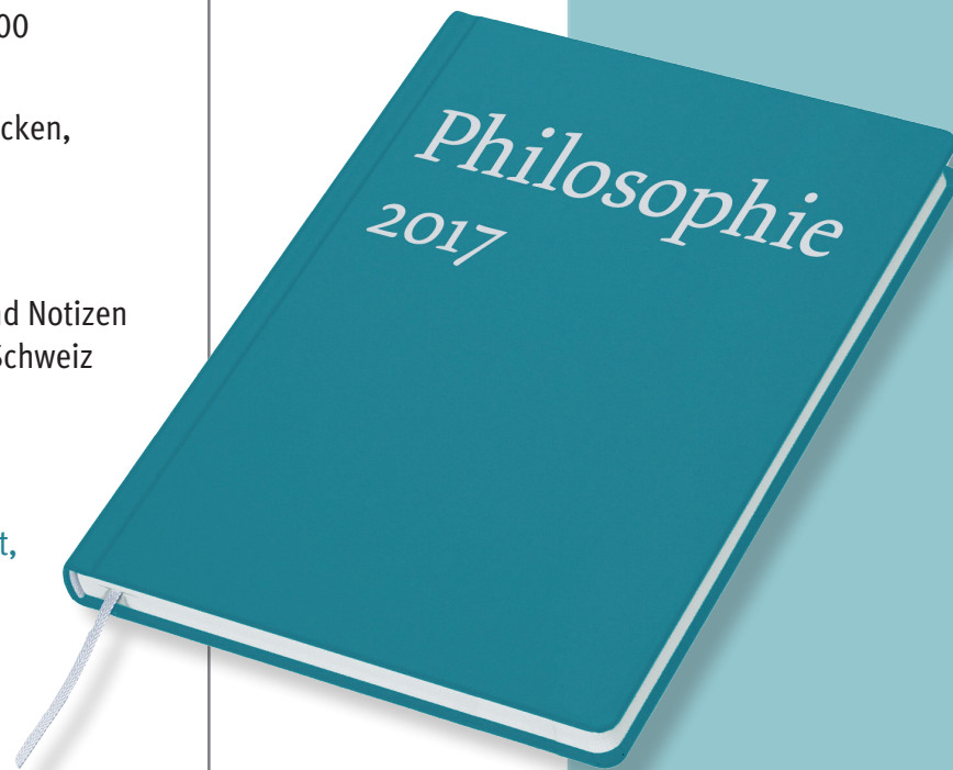
Abbildung in Originalgröße